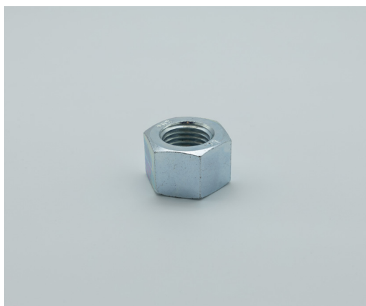
Écrou A194-2H Acier Zingué