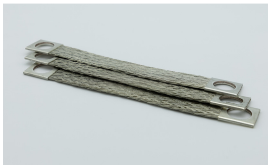
Tresses de masse (Schunts) En cuivre étamé